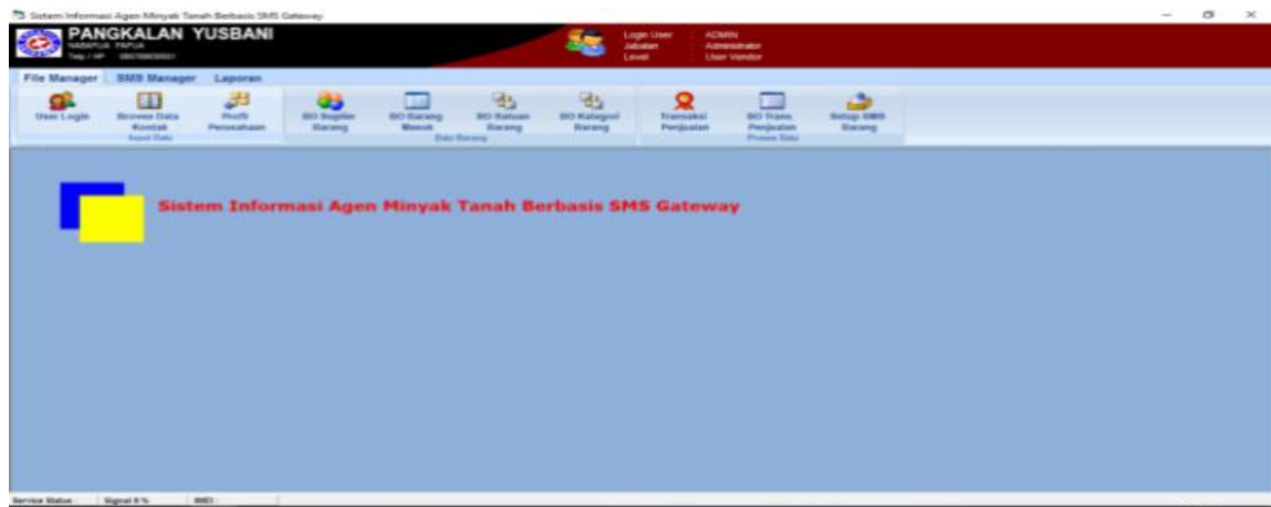
Gambar 2 .Form Tampilan Utama