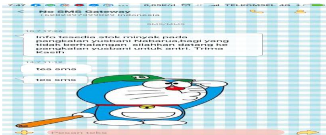
Gambar 5 Tampilan Hasil SMS Masuk

Tampilan ini merupakan sms atau pesan berisi informasi yang masuk pada no pelanggan. Berikut ini adalah gambar 5 tampilan sms masuk