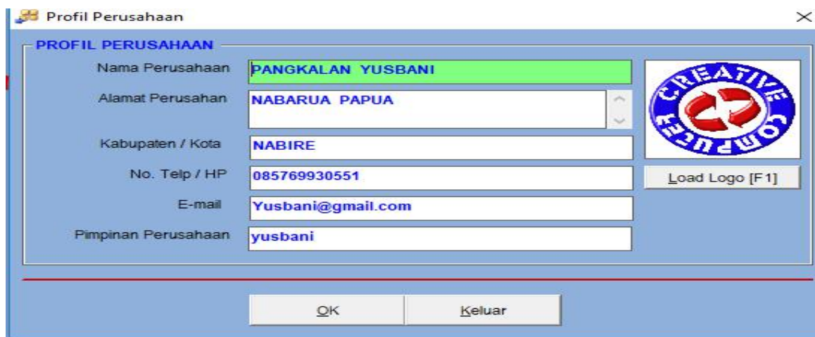
Gambar 3 Tampilan Profil Perusahaan

Form profil perusahaan adalah form yang digunakan untuk menampilkan data perusahaan. Adapun tampilan form perusahaan pada gambar 3 berikut ini.