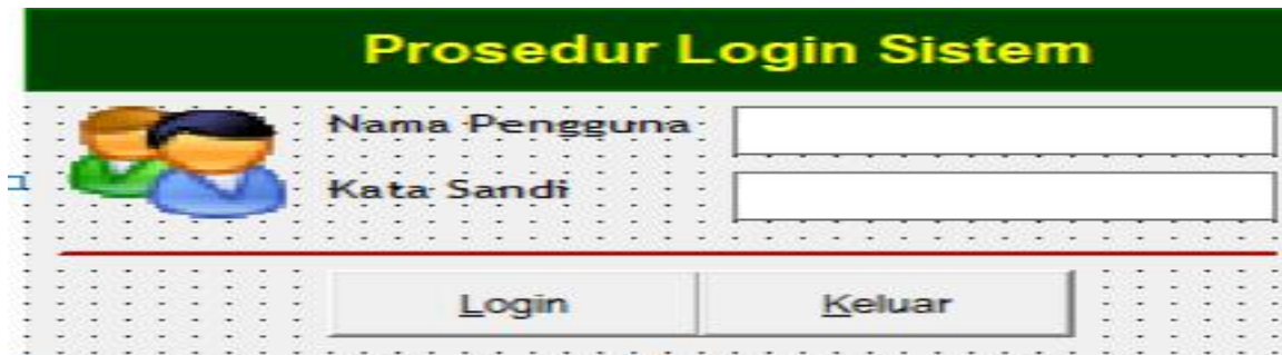
Gambar 1. Tampilan Form Login

Tampilan yang pertama tampil yaitu form login. Tampilan login diperlukan untuk mengakses sistem. Pada halaman ini harus mengisi nama pengguna dan mengisi kata sandi. Tampilan halaman login perhatikan pada Gambar 1 berikut ini.