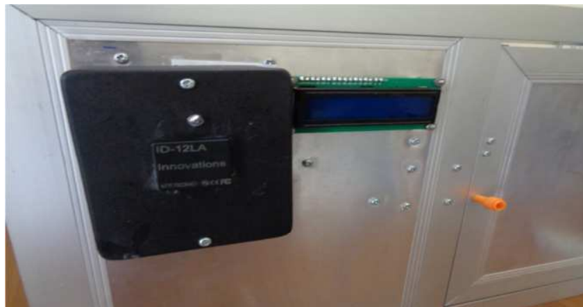
Gambar 3.5 Bentuk Fisik Kunci Pintu

Tag RFID akan menerima suatu sinyal berupa frekuensi tertentu dari transponder RFID, yang menyebabkan tag RFID tersebut aktif. Setelah mendapat sinyal tersebut, tag RFID akan mengirimkan kode unik dalam bentuk hexadesimal ke transponder RFID untuk selanjutnya data tersebut akan diolah oleh mikrokontroler, kemudian jika data tersebut sesuai dengan data yang telah tersimpan dalam memori data mikrokontroler maka akan mengaktifkan solenoid.