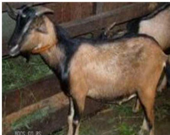
Gambar 2. Bibit kambing kacang Jantan dan