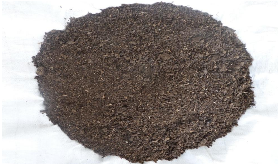
Gambar 1. Kondisi Fisik Pupuk Organik Produksi Kelompok Tani 'Sidodadi'

Kondisi fisik-organoleptik pupuk organik ini perlu mendapatkan perhatian karena apabila kondisinya lengket (tidak remah), berbau busuk (seperti bahan organik asalnya) dan berwarna yang tidak cerah karena berjamur maka secara estetika menimbulkan sugesti perasaan jijik (menjijikkan) sebagaimana melihat asal bahan organiknya yang berupa limbah/ sampah maupun feses (kotoran hewan) yang banyak orang jijik melihatnya. Hal ini akan menghambat penggunaan pupuk organik yang dihasilkan, dan pupuk menjadi mubazir.