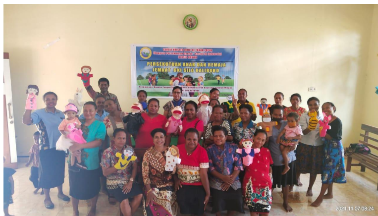
Gambar 3 Peserta Kegiatan Pengabdian Masyarakat