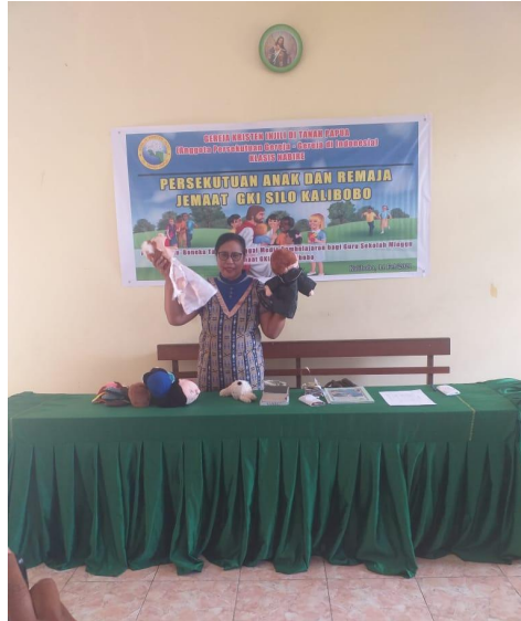
Gambar 2. Praktek Penggunaan Media Boneka

kepada orang tua dan pembina sekolah minggu. Setelah proses teknikal pembagian peran kepada setiap orang. Langkah berikutnya diberikan contoh praktek menggunakan boneka di depan peserta.